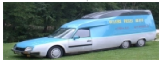
Le camion de Gilbert Villiers Pièces Auto

Rassemblement pour 09 heures sur le parc du château pour le rallye fléché de 80 km préparé par Gilbert A_Z. Pose des plaques de rallye sur les voitures et en route à la découverte du très beau circuit sur beaucoup de petites routes. Retour sur le parc vers 13heures car les estomacs commençaient à gargouiller.